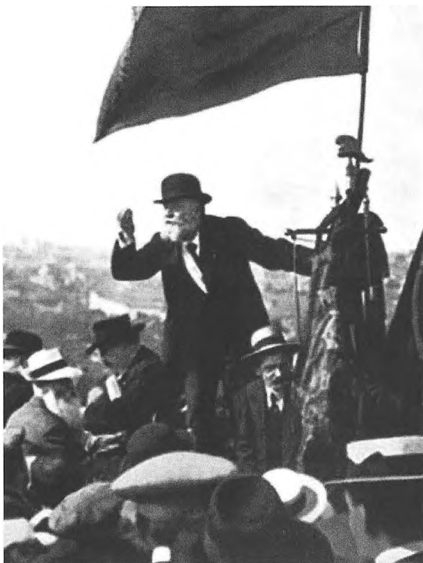
Jean Jaurès, le 17 juillet 1913, prononçant son discours contre le projet de loi rétablissant le service militaire de trois ans.